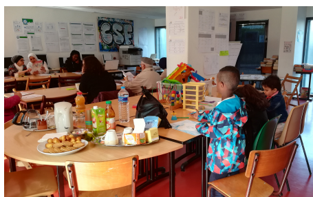
CSF, Réunion à Bayonne le 2 mars, choix des gestes

« Je suis déjà dans une démarche anti-gaspillage mais j'ai besoin de connaître des astuces » Léa. Bretagne