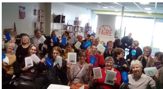
CLCV, Réunion à Lille le 19 janvier avec la remise du matériel de pesée