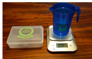
Le matériel de pesée remis à chaque foyer.

Chaque foyer pèse, chaque jour, 4 catégories de gaspillage alimentaire :